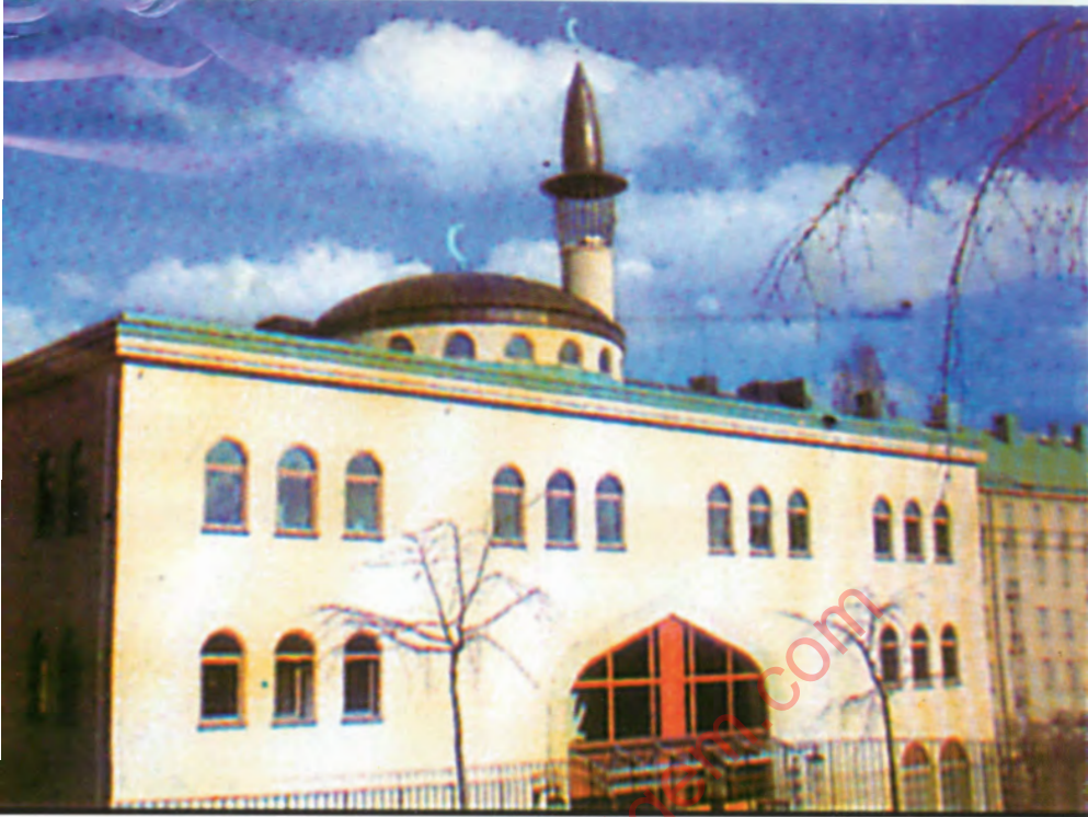
اشفاق ہوم کی مرکزی مسجد